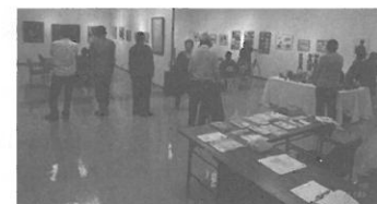
2014年11月の第5回文化・美術展会場

隔年開催の建築ネット文化・美術展を10月20~23日、新宿区民ギャラリー(中央公園内)で開催し