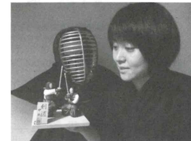
恩師にいただいた、剣道博多人形を手に。世代や分野を越えて交流できるのが楽しい。

技術部会に参加させていただいていますが、皆さん、とてもパワフルで親切。いつも励まされています。違う分野の方々と知り合い、新しいことを勉強できるのは、剣道の稽古をする時の