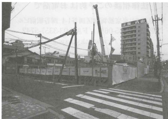
業者は近隣住民の日差しを奪うマンション建設を強行する構えだ

日差しといえば、博識の諸賢はギリシャの哲学者ディオゲネスとアレキサンダー大王の逸話を思い出すであろう。禁欲的な生活を送っていたディオゲネスに大王が「おまえの欲しいものは何か」と問うたところ、「そこをどいてほしい。日差しが