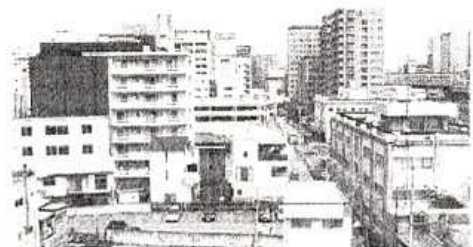
写真上。見学で訪れた高崎市街風景。