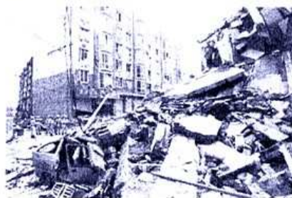
崩壊した震源地・ブン川(ぶんせん) 東映秀の中心部 =17日、石井倫撮影、毎日新聞