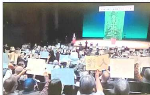
第35回は会場とワケイ開催だったので、zoom画面を撮影

第36回「日本高齢者大会」が11月12、13の両日、東京で開催されます。12日は大正大学(豊島区)で講座・分科会・交流会が、13日は文京シビックホール(文京区)で全体会が開かれ、主催者側は両日で3,500人の参加を見込んでいます。2020、21年はコロナ禍で中止、2022年は再開したものの人数制限下で行われており、従前の規模、形態としては4年ぶりの開催となります。