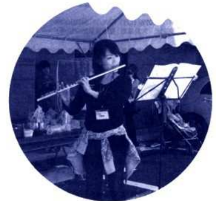
居住者のフルート演奏でうっとり

24世帯マンション「ソレアード日野」 「ふれあい祭」重ねて8年 餅つき、フルート演奏などで交流