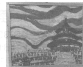
天壇(油彩、鈴木志朗)