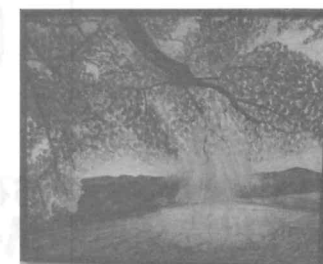
秋の夕日に照る山紅葉 (油彩、添島幸雄)