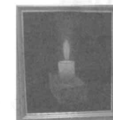
希望の一燈(油彩、小池秀雄)