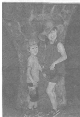
孫 姉と弟 (油彩、渡辺政利)