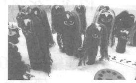
あまびえ(廃材工芸、安部勝己)