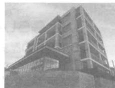
住宅地の狭いスペースに 小規模のマンションが……