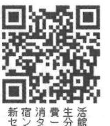
新宿消費生活 センター分館

会場 新宿消費生活センター分館(高田馬場駅より徒歩3分) ☎03-3205-1008 オンライン会議(ZOOM)必ず、メールでお申し込みください。時間 毎回午後6時15分～8時30分。 会費 会員外:500円/回、2500円/6回、会員:300円/回、1500円/6回。 申込 NPOネットワークセンター ☎03-6457-3178 メール kenchiku@d2.dion.ne.jp *諸事情で、講師やテーマを変更することがありますので、ご了承ください。