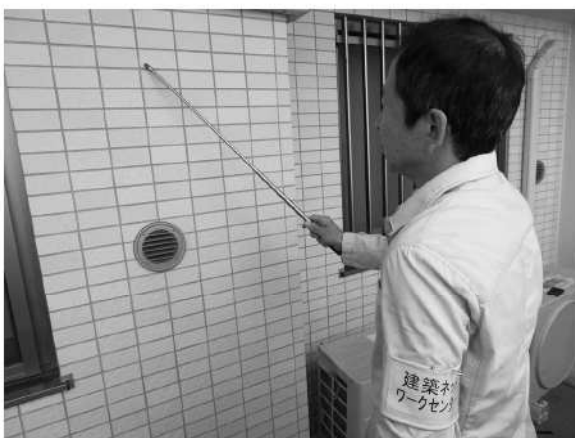
タイルを一枚一枚たたいて音判断

いのにとまってしまいたいほどで、一日中足場において神経を尖らせるも退屈もする。叩いて音でモルタルが浮いているか、いやいやタイルがモルタルの上で浮いているか、それは貼り替えなければいけない状態なのか判定し、色別のテープをちぎって貼って行く。業者は仕事が激減するから機嫌が悪い。急遽明日現場に置いて、打音専門業の彼らに説明することになりました。一つの勝負どころです。